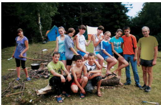
Біля табірної багаття

вчитель Річківської ЗОШ І-ІІІ ст., керівник туристського табору "Едельвейс"